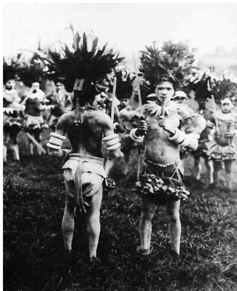
Figure 2 : Candidats au rituel d'initiation So, vêtus d' obom .

2022). Mais en fait, tout commence plus de quarante ans au paravent, à la suite de l'arrivée des premiers missionnaires au Cameroun, venus d'Amérique (Jean Criaud et al. 1992). Il en découle un début de changements dans les mœurs des populations 9 .