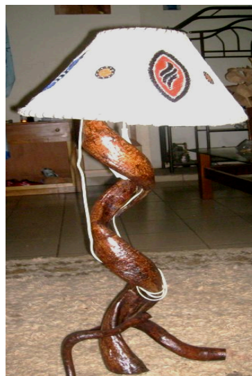
Figure 4 : Abat-jour en liane et obom Création : Meye Yves, 2020

De nos jours, il est courant de voir les garants de la tradition, ces hauts dignitaires que sont les chefs traditionnels du Cameroun méridional arborer l' obom lors de certaines solennités 14 . En effet, la culture de la