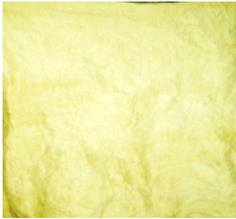
Figure 1 : Une étoffe d'écorce battue tirée de l'essence Andom .