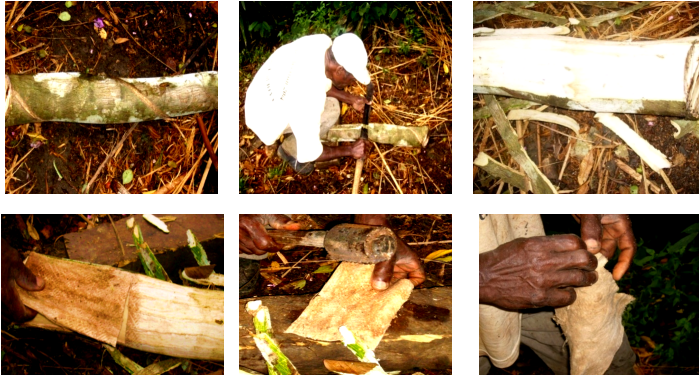
Figure 8 : Étages d'obtention du tissu obom .

Une fois que l'arbre est choisi dans le site d'extraction, l'artiste ou l'artisan l'abat. D'autres en revanche prélevaient directement l'écorce de l'arbre, pour en faire une étoffe d' obom . Ce second cas privilégie la protection environnementale, la réduction des effets de serre, conformément aux objectifs de développement durable. L'arbre peut ainsi prolonger sa durée de vie et son écorce peut se régénérer après une certaine période.