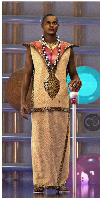
Figure 7 : Mannequin vêtu d' obom Création 3D : Bibi Kent's, 2023